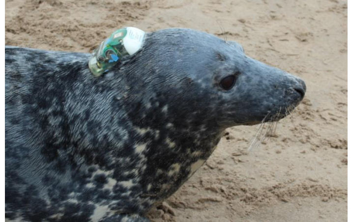
Morlo llwyd gyda thag GPS.

Pwy? Tîm profiadol Uned Ymchwil Mamaliaid Morol, Prifysgol St Andrews, sydd wedi tagio dros 1,000 o forloi, sy'n gwneud y gwaith yma.